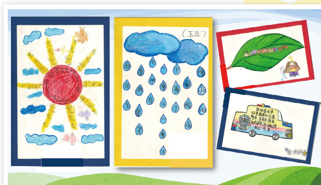
▲ 小一學生創作的圖像詩，充滿想像力和創意。

為啟發學生的想像力和創意，校方特設兒童文學課，每年共教授三個兒童文學單元。老師會運用《活學中國語文》的延伸單元、繪本及自編教材，讓學生接觸不同類型的故事、童詩等，再進行個人或小組創作，以文字、圖像、手工、口頭匯報及話劇等形式表現出來。以《活學中國語文》關於圖像詩的單元為例，學生在瞭解圖像詩的特點和欣賞不同的作品後，便會嘗試模仿創作；又如安排學生閱讀寓言故事後，進行小組創作故事或角色扮演。多接觸文學作品和創作後，該校老師發現，學生無論是閱讀興趣，還是反思、協作和創造能力皆有所提升。